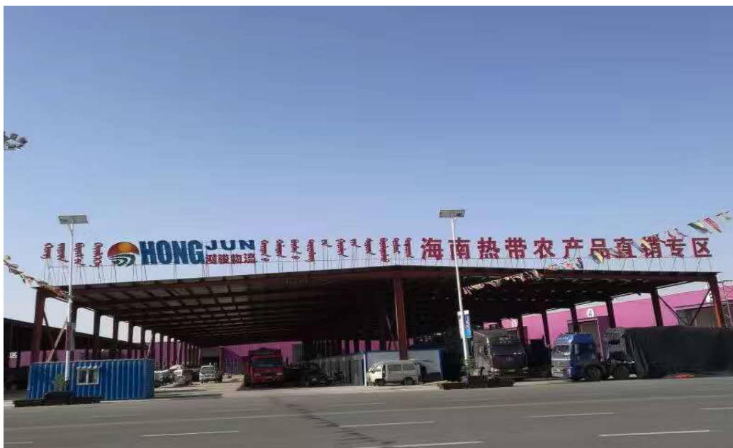
公司农产品直销专区