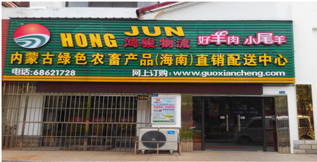
公司直销配送中心

公司凭借客户及物流优势，直接向海南本土农业企业、农民专业合作社或农户采购农产品，借助自有的物流运力及各配送专线设有的物流配送中心、联络服务销售网点，将海南特色的热带果蔬运抵全国各地进行直销，该模式在缩减中间环节流通成本的同时，也增加了公司的利润空间。