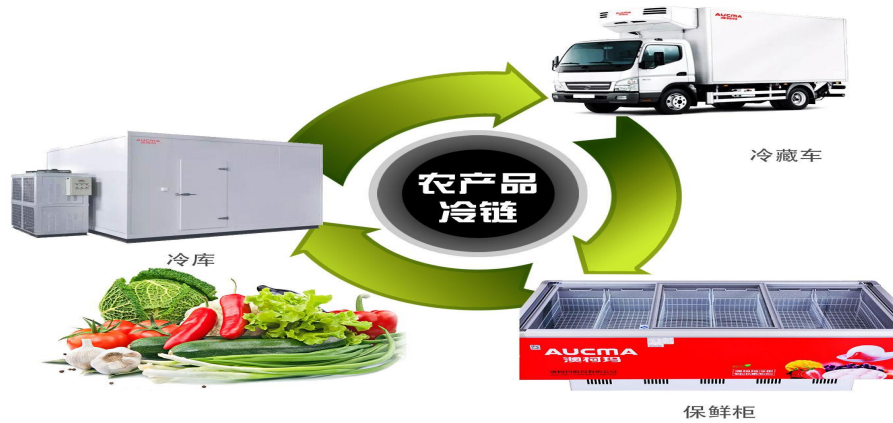
农产品冷链物流示意图（二）

打造互联网+冷链仓储物流，线上集即时询价、网上交易、信息发布、质量追溯为一体的服务，线下运用海陆空联合运输方式进行冷链仓储物流快捷服务。为农商企业、生产基地、农民合作社和农产品营销企业提供安全、便捷、实用、高效的电商冷链物流配送服务。